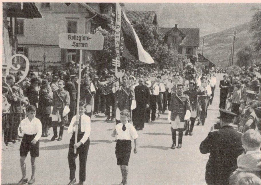
Die Studentenmusik am Musikfest in Kerns

geartete Mannschaft mehr mit der unsern messen. Das Wettspiel gegen den F. C. Sarnen am 30. Juni endete zugunsten des Kollegiums mit 3:2.